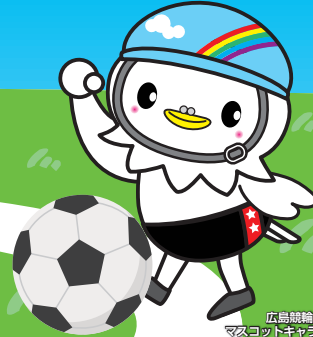
広島競輪 マスコットキャラクター ひろしまびーすけ