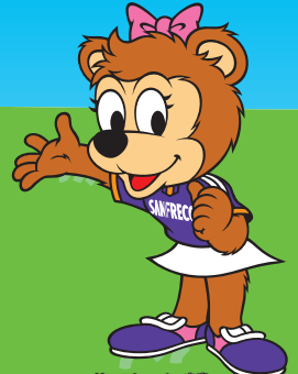
サンフレッチェ広島 クラブマスコット フレッチェ