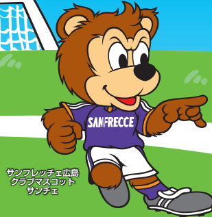
サンフレッチェ広島 クラブマスコット サンチェ